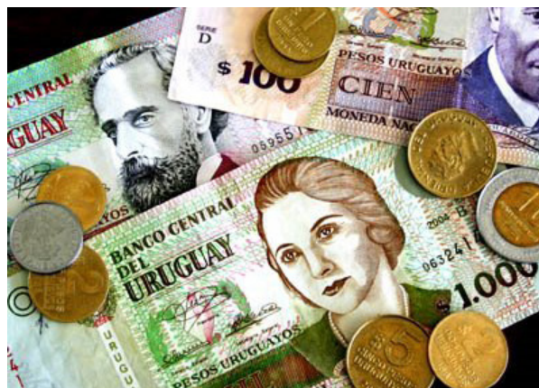
Peso uruguayo.

la JND como a través de proyectos de liderazgo por la sociedad civil. Dentro de este marco, se realiza un llamado a fondos concursables. Es importante destacar que la ley estipula que los proyectos financiados por el FBD no deben reemplazar las obligaciones del Estado mismo en este campo 3 .