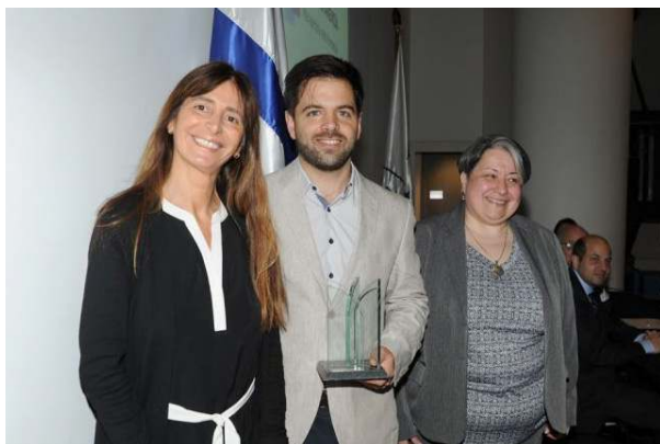
El proyecto de FBD obtiene el Primer Premio a la Transparencia de la Gestión.

Según una evaluación de los proyectos entre 2011 y 2014, a un año o un año y medio de haber sido derivados a un proyecto de inclusión social, un 50% se encuentran trabajando; el